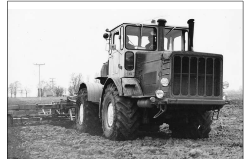
Auf diesem Foto ist der K 700 abgebildet, den wir schon im Septemberblatt näher beschrieben haben.

Auf dem Bild im Kalender ist im hinteren Teil der Maschine eine Spreuauffangvorrichtung zu sehen, die eigentlich nicht zur Originalausrüstung des Stalinez 4 gehört.